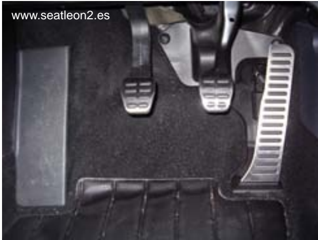
Pedales sin reposapias