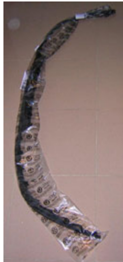
1ML 805 903