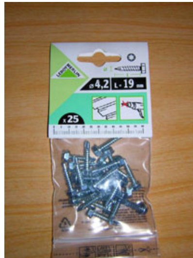
Tornillos rosca chapa hexagonales