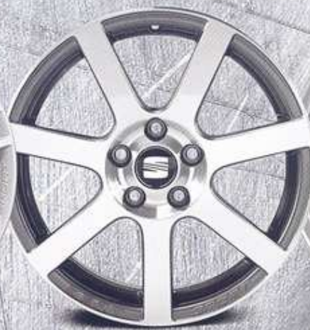
Llanta de aleación de 17" antifacita plata pulida (5P0071491) o titanio claro mate (5P0071490).