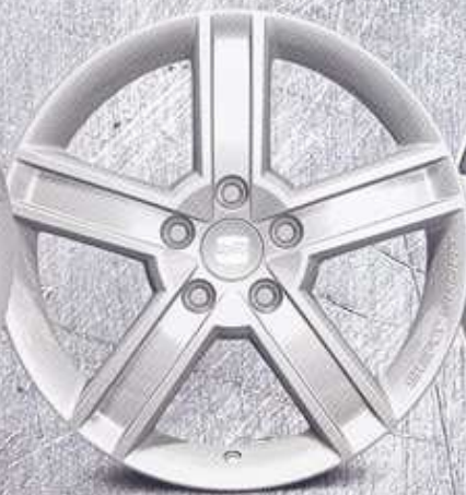
Llanta de aluminio de 17" color plata (1P0071490).