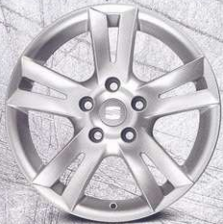
Llanta de aleación de 16" (5PS071490).