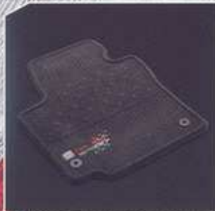
Alfombra moqueta Velpic SEAT Sport (5P0061510).