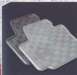
Alfombras de caucho en negro (1P1061500 041) o gris (1P1061500 528).