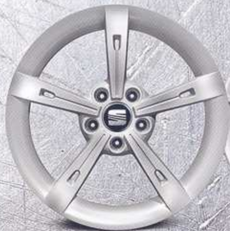
Llanta de aleación de 17" Alhena (SP0601025D).