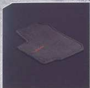
Alfombra moqueta negra Velpic (1P1061525 041).

No será necesario que hagas uso de la memoria para ver tu coche como el primer día. Basta con haber tenido siempre a mano los productos de conservación originales que SEAT Accesorios ha desarrollado para ti.