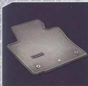
Alfombra moqueta gris Velpic (1P1061525 528).